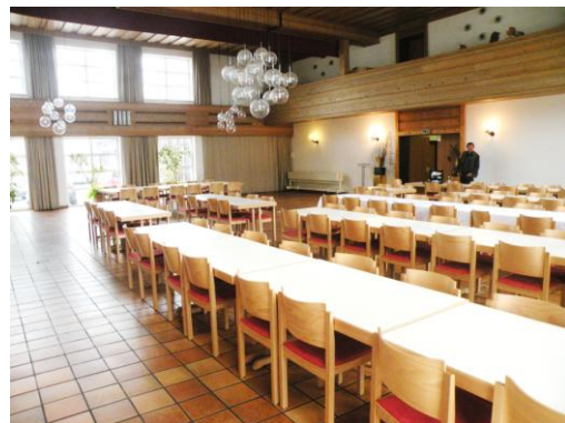
Saal des Landwirtschaftlichen Bezirksvereins Passau