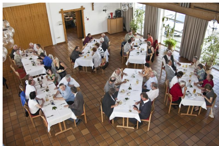
Unsere Vereinsmitglieder mit Angehörigen beim Festabend