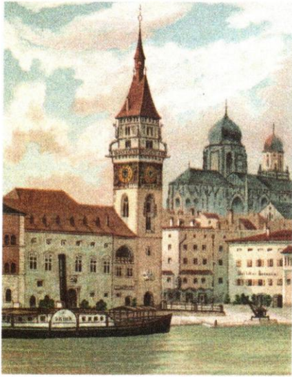
1909 - 2009 100 JAHRE BRIEFMARKEN SAMMLERVEREIN PASSAU