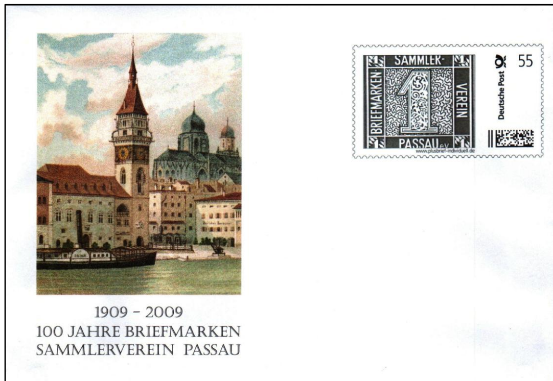
Plusbrief individuell mit Eindruck unseres Vereinslogos und der Stadtansicht von Passau

Außerdem bestellten wir 200 Plusbriefe individuell DIN A 6 Normalformat und 100 Plusbriefe Individuell DIN A 6 Langformat mit dem Eindruck unseres Vereinslogos. Das Bild vom Passauer Rathaus mit dem Donauschiff ließen wir nachträglich aufdrucken. Da diese Plusbriefe nicht mit dem Sonderstempel entwertet werden durften, haben wir vergeblich versucht, einen Tagesstempel des Postamtes Passau zu bekommen. Auch Weiden konnte uns hier nicht behilflich sein. Als Notlösung werden wir diese Plusbriefe nach Beendigung unserer Werbeschau in einer Postagentur in Passau mit dem Tagesstempel abstempeln lassen