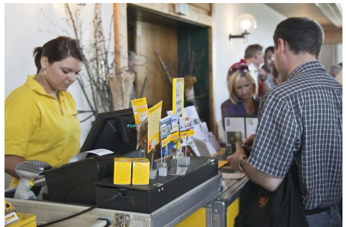
Der Stand der Österreichischen und der Deutschen Post