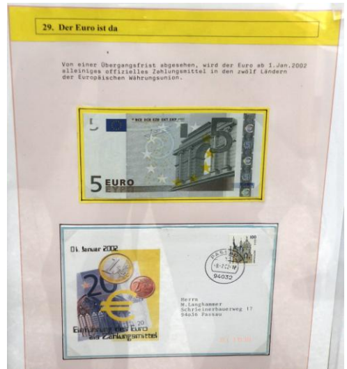
Währungen im Laufe der letzten 100 Jahre