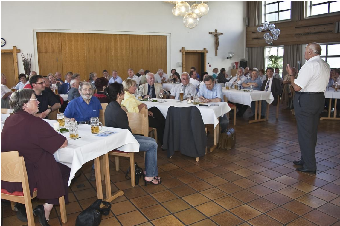
Festansprache des 1. Vorsitzenden